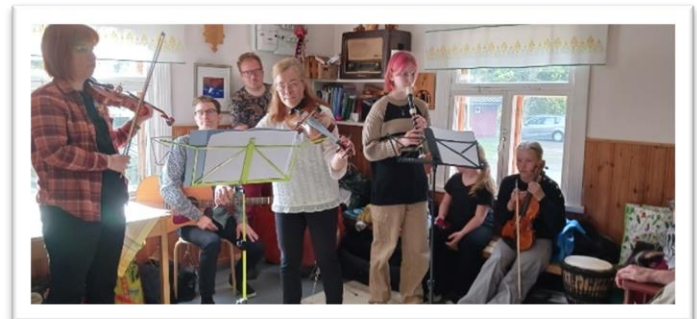
Kuva 6; ”Haukkalan pelimannit”