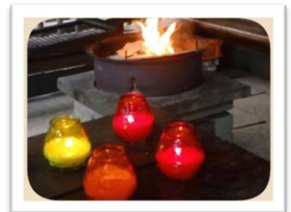
Kuva 5; Venetsialaisten tunnelmaa