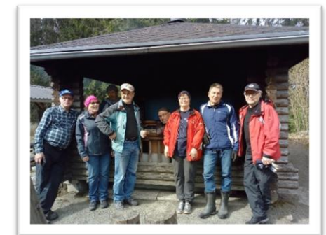
Kuva 2; Talkoolaisia grillikatoksella

Päivä päätettiin saunan lempeissä löylyissä ja Tuomiojärven vielä hie- man viileässä syleilyssä, jonne saunan lämmöstä laskeudut rauhalli- sesti. Hengität. Nautit veden lumoavista vaikutuksista. Nouse vedestä ja tunnet, kuinka hyvä olo ja lämpö valtaa koko kehosi. Monelle uinti talven jälkeen avovedessä olikin tämän uimakauden ensimmäinen, joten talviturkki tuli heitettyä.