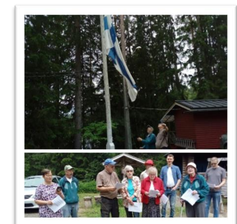
Kuva 3; Lipunnosto & Kiviniemen sekakuoro

Jos sielu lepäsi saunan lämmössä niin ruumiin ravintoa tankattiin mm. muurinpohjaletuilla ja grillimakkaralla. Lettujen paistomestareina vuo- rottelivat Antero ja Leena. Pilvipoutaisessa säässä saunojia kävi päivän ja illan aikana noin 40 nauttien Suomen suven juhlasta hyvässä seu- rassa.